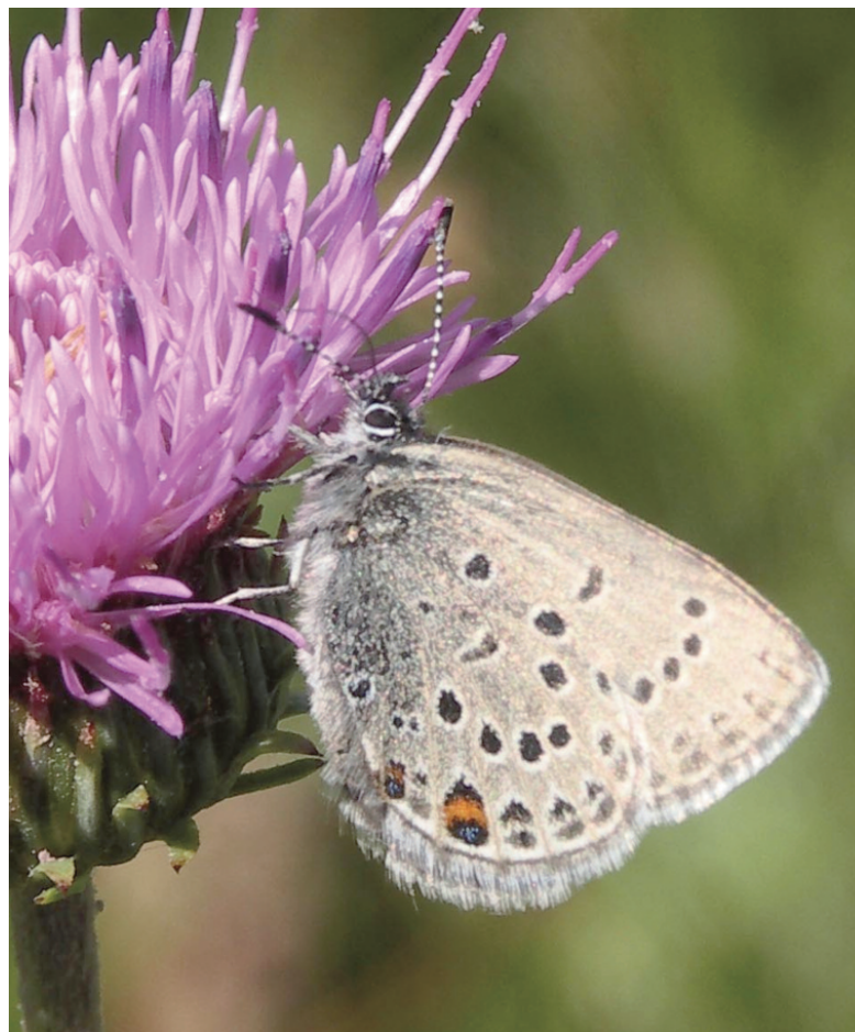
Fig. 4 – Esemplare femmina di Plebeius optilete