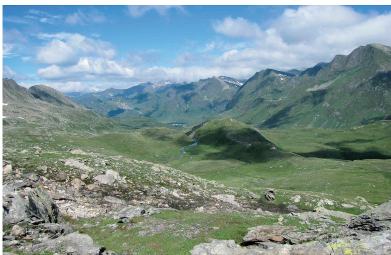
Fig. 2 – I prati alpini della Val Pióra visti dalle pendici del Pizzo del Sole.

vasta, sia nelle condizioni meteorologiche avverse che hanno condizionato i rilievi. Inoltre in tutto il settore alpino l'andamento climatico stagionale ha comportato una notevole anomalia nella fenologia delle farfalle d'altitudine rispetto alla norma. Gli autori segnalano pertanto la necessità di promuovere ulteriori indagini nel territorio della Val Pióra, anche per confermare alcuni dati storici decisamente molto vecchi, come ad esempio quelli riferiti a Pontia callidice , Erebia pluto e Euphydryas cynthia risalenti al 1899. Altri necessiterebbero invece di una verifica delle determinazioni, come nel caso di Coenonympha gardetta e Aricia agestis .