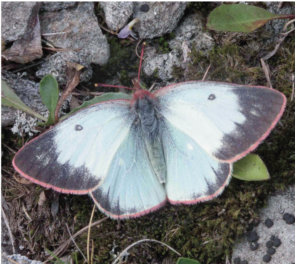
Fig. 3 – Esemplare femmina di Colias palaeno