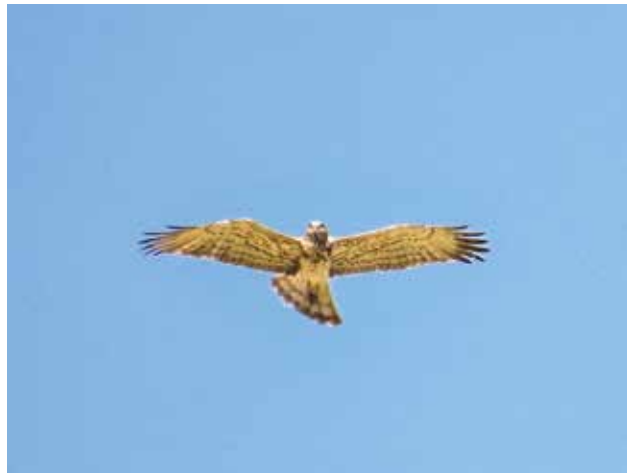
Figura 11: Biancone adulto con un serpente che sporge dal becco per alcuni centimetri (poco visibile a causa della ripresa frontale), fotografato a due giorni di distanza nella stessa zona dell'esemplare ritratto in Fig. 10. Questo esemplare, anch'esso probabilmente un maschio, non presenta remiganti primarie in muta, ma solo una piccola intaccatura sul margine posteriore della remigante p6 dell'ala sinistra (L. Pagano, 4.5.2016).