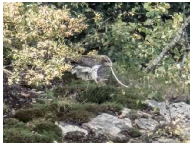
Figura 9: Quando l'apporto di serpenti avveniva in tempi ravvicinati, il giovane non divorava subito la preda ma ci "giocava" a lungo, spostandola e tirandola da più parti (F. Rampazzi, 3.9.2016).