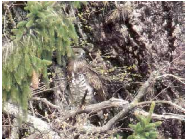
Figura 5: Da grande distanza la colorazione e il disegno screziato del piumaggio rendevano difficilmente individuabili gli esemplari di biancone sul sito di nidificazione (mimetismo distruttivo). Femmina fotografata poco dopo la copula da oltre mezzo chilometro di distanza.

Il giovane ha soggiornato al nido almeno fino al 18.8.2016, poiché l'adulto ha continuato a portargli serpenti fino a quella data. In data 22.8.2016 la coppia volava a lungo sul vallone sopra il luogo di nidificazione, forse per spronare il giovane ad abbandonare il nido. La prima osservazione del giovane fuori dal nido risale infatti al 23.8. L'involò deve quindi essere avvenuto tra il 19.8 e il 23.8.2016, ciò che corrisponde a un'età di 77-84 giorni. Nei giorni immediatamente successivi all'involò il giovane restava a lungo appollaiato sui rami degli alberi circostanti, scrutando i dintorni e dedicandosi alla pulizia del piumaggio, ma compiva pure i primi brevi voli sul luogo di nascita (Fig. 8). Successivamente, durante il lungo periodo di emancipazione, si soffermava spesso su un costone roccioso della zona che perlustrava a piedi e dove attendeva il ritorno dell'adulto con la preda (Fig. 9). Sebbene la distanza e la posizione del punto di osservazione non permettesse di identificare le prede, è possibile affermare che si trattava per lo più di serpenti di grandi dimensioni, poiché la coda sporgeva spesso per decine di centimetri dal becco. In un paio di occasioni è stato possibile osservare chiaramente il passaggio di un grosso serpente tra il maschio e la femmina su un abete in prossimità