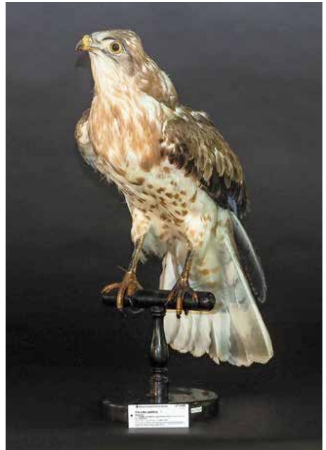
Figura 12: Giovane biancone catturato il 25.8.1872 a Capo San Martino e oggi conservato nelle collezioni del Museo cantonale di storia naturale di Lugano (n. VT0320). Nonostante il cattivo stato di conservazione, il piumaggio giovanile è riconoscibile per la "pettorina" bruno-rossiccia e per altri caratteri non direttamente visibili nell'immagine.