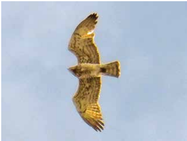
Figura 10: Biancone adulto, probabilmente maschio, fotografato a circa 10 km di distanza dal nido. In questo esemplare è assente la remigante p3 sull'ala sinistra (L. Pagano, 2.5.2016).