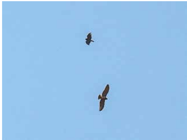
Figura 1: Coppia di bianconi nei giorni dell'arrivo sul luogo di nidificazione. In volo la femmina era riconoscibile per il tipico cappuccio marrone uniforme ben delimitato sul petto e per le dimensioni leggermente maggiori, mentre il maschio, dal disegno meno marcato e appena più piccolo, aveva l'ala sinistra in muta sulle remiganti primarie (, 29.3.2016).

Le osservazioni si sono sempre svolte con l'ausilio di binocoli e di un cannocchiale (25-60x) dal versante opposto a quello del sito di nidificazione a una distanza di 500-600 m. Soltanto dopo metà luglio, un mese e mezzo dopo la schiusa, si è ritenuto possibile avvicinarsi maggiormente al nido, al fine di verificare brevemente da un'altra posizione e con un'altra angolazione lo sviluppo del giovane. La documentazione fotografica e video è stata realizzata in digiscoping e per mezzo di apparecchi fotografici muniti di teleobiettivi (zoom 24-2000 mm, ingrandimento fino a 83x).