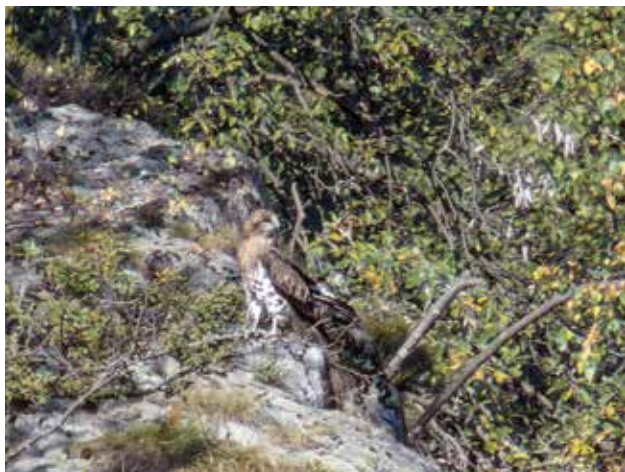
Figura 8: Giovane biancone su un costone roccioso poco lontano dal luogo di nascita in attesa del ritorno dell'adulto con la preda. Si noti la pettorina di colore marrone-rossiccio chiaro uniforme che lo distingue dall'adulto. Da distante questa colorazione non è sempre facilmente riconoscibile e dipende fortemente dalle condizioni di luce del momento.