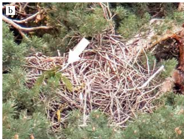
Figura 4a e b: Vecchio nido presumibilmente di biancone posto in cima a un pino silvestre, forse già occupato dalla coppia in anni precedenti. Il nido è stato inizialmente rifornito con 4-5 rametti di abete rosso (freccia) a distanza di tre giorni (F. Rampazzi, 6.4 e 9.4.2016).

possibile osservare fuggacemente un esemplare in arrivo o in partenza dal nido.