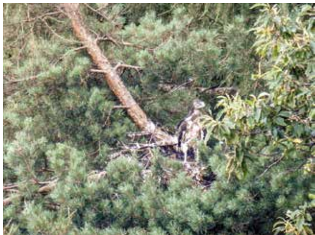
Figura 6: Giovane biancone al nido all'età di 46-49 giorni. Il piumaggio è ancora intermedio tra quello di pullus e quello giovanile.

Tra la seconda e la terza settimana di settembre il giovane biancone passava sempre più tempo in volo, allontanandosi fino a circa un chilometro dall'area di nidificazione, per poi farvi sempre ritorno. Talvolta volteggiava a lungo alto nel cielo (in data 16.9.2016 senza posa per 20-25 minuti di seguito), dove a tratti si esibiva in brusche virate e improvvisate picchiate. La data del 16.9.2016 è stata l'ultimo giorno di avvistamento del giovane nella zona. Un biancone adulto (in muta sulle remiganti primarie dell'ala sinistra) è stato ancora avvistato il 20.9.2016 a circa 8 km dalla zona di nidificazione, ma non è possibile sapere se si sia trattato di uno degli esemplari della coppia nidificante.