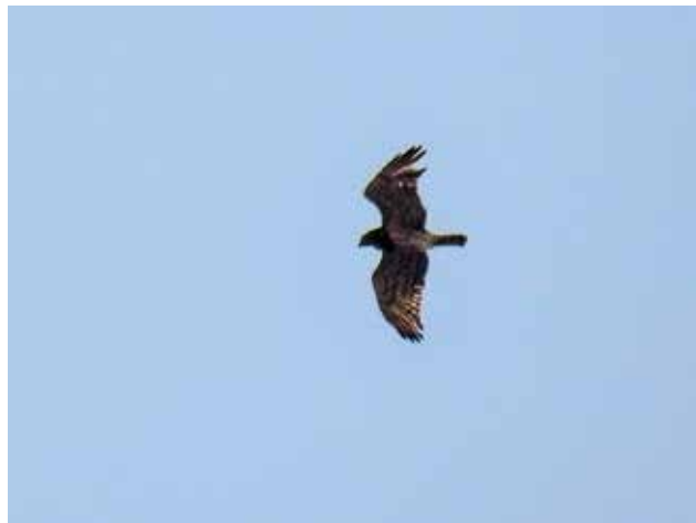
Figura 2: Tra la fine di marzo e le prime settimane di aprile il maschio era riconoscibile per l'assenza della remigante p6 sull'ala sinistra (, 29.3.2016).