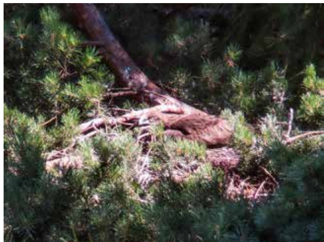
Figura 7: Giovane al nido all'età di 60-63 giorni. Il piumaggio è ora assai simile a quello dell'adulto (F. Rampazzi, 2.8.2016).