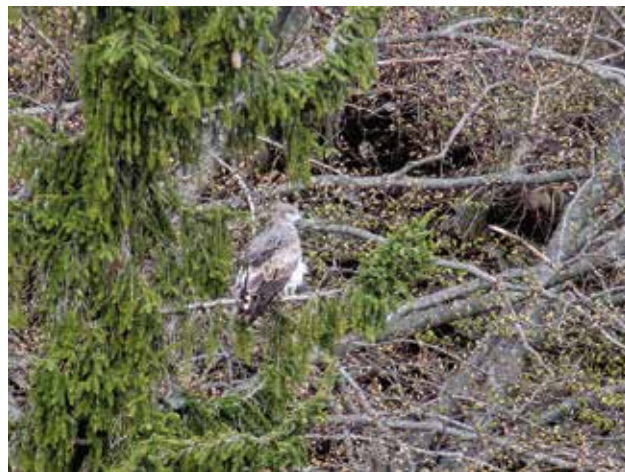
Figura 3: Durante il periodo di scelta del luogo di nidificazione la coppia restava a lungo appollaiata sui rami degli alberi più alti, talvolta anche in posizione molto esposta. Nell'immagine la femmina (, 15.4.2016).

Il nido è stato individuato qualche giorno più tardi, in data 22.4.2016. Un individuo, probabilmente la femmina, è stato visto volteggiare brevemente sul luogo di nidificazione e posarsi pochi istanti dopo nel fitto della vegetazione. Il nido si trovava tipicamente sulla sommità di un pino silvestre, assai celato in mezzo alle fronde di alcune conifere e latifoglie. Esso non era direttamente visibile dal nostro punto di osservazione, situato a circa 500 m di distanza. Solo l'arrivo e la partenza di uno dei due esemplari, per altro assai furtiva e di difficile detezione, ne tradiva la presenza. Dal momento della deposizione in poi il comportamento dei bianconi si era fatto assai più schivo, tanto che solo con grande difficoltà e dopo lunghe attese (anche di molte ore) era